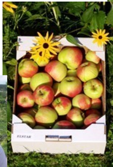
5 kg nur €11,-

Mit deiner Bestellung erhältst Du hochwertige und naturbelassene Lebensmittel zu einem tollen Preis.