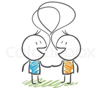
Handshake and communication